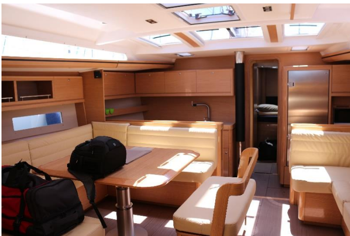
Salon von FRISKA