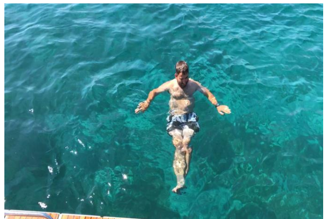
Baden im glasklaren Wasser