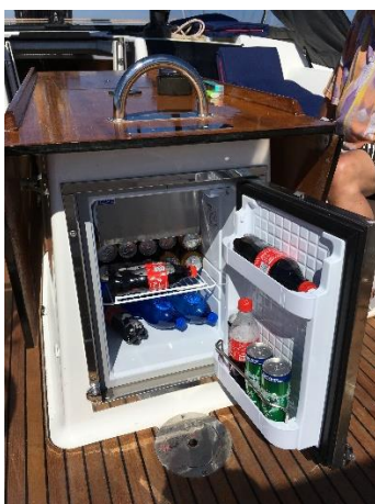
Kühlschrank im Cockpit