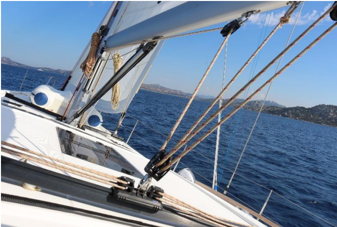
Segeln zwischen den Inseln des Maddalena Archipels