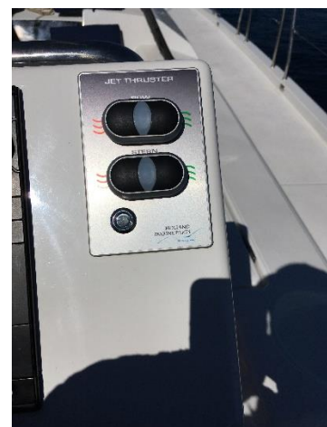
Bug- und Heck-Strahler bzw. -Jet (wie bei einem Jetski)