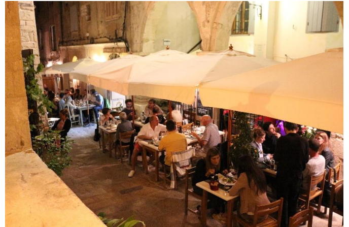
Nachtessen in Bonifacio